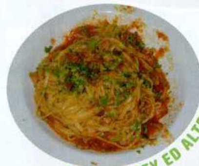
PASTA PARTY ED ALTRO...