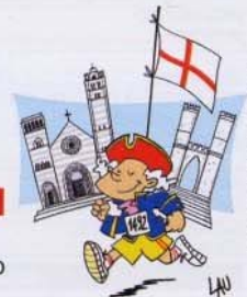
La maglietta della Gara

A.S.D. CAMBIASO RISSO RUNNING TEAM GENOVA vi aspetta: il 13/07/08 al 3 ^ Memorial Queirolo di 8,5 km a Ferrada di Moconesi (Ge) per "La corsa di Fede" il 28/09/08 alla 1 ^ Salita alla Guardia di 8 km alla Gaiazza (Ge) lungo il percorso della ex - Guidovia per informazioni: www.cambiasorissorunning.it