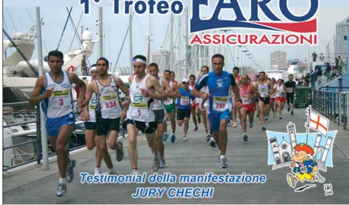
Testimonial della manifestazione JURY CHECHI

Corsa su strada di km 10 partenza ore 9.00