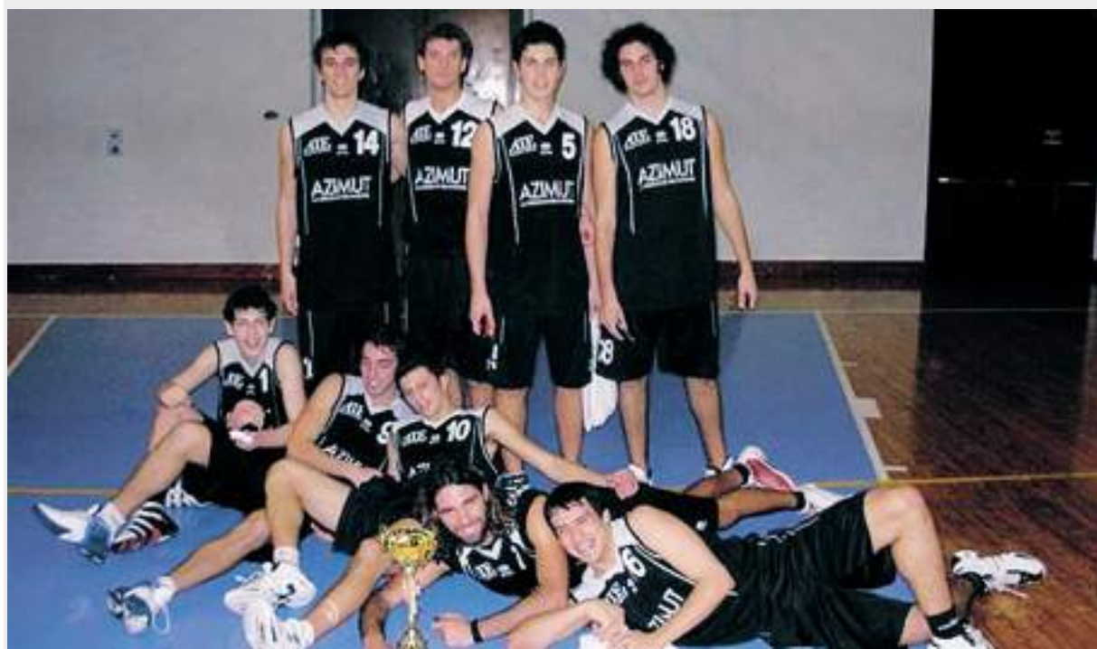
La gioia dei giocatori dell'Azimut Pool Loano dopo la conquista della coppa Liguria

L'AZIMUT SUPERA SESTRI Ponente e SARZANA E SI AGGIUDICA LA COPPA LIGURIA